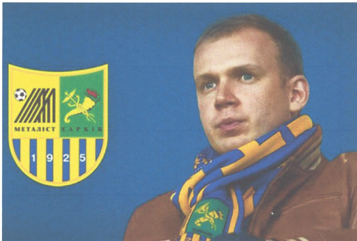
Сергей Курченко купил харьковский футбольный клуб «Металлист»

Денежная масса распирает стенки холдинга Курченко изнутри. Теперь его конгломерат переименован в «ВЕТЭК» (Восточно-Европейская топливно-энергетическая компания). Одесский нефтеперерабатывающий завод, харьковский футбольный клуб «Металлист», Брокбизнесбанк — структуры Курченко скупают все, что представляет хоть какой-то интерес.