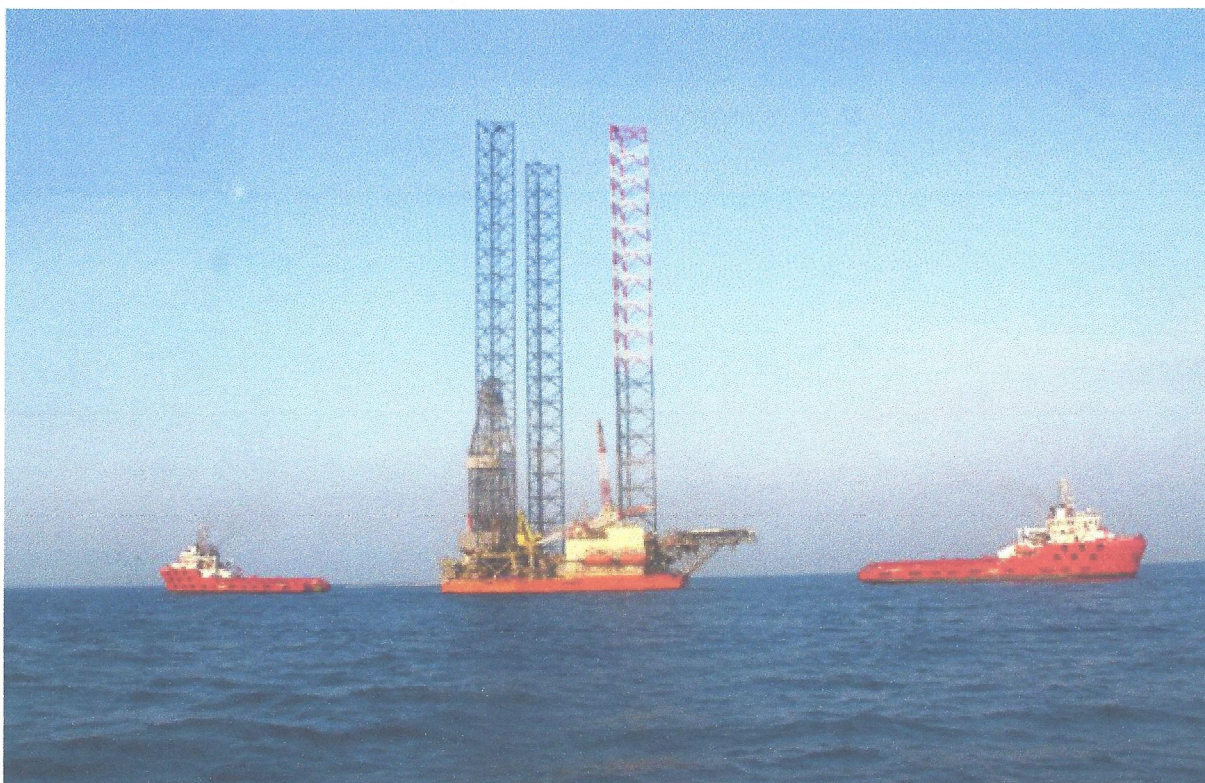
На этой буровой установке «наварили» 150 млн. долл.

Британскую фирму-прокладку Highway Investment Processing LLP, накрутившую 150 миллионов долларов на цене буровой платформы, учредили две офшорные компании: Ireland & Overseas Acquisitions Limited и Milltown Corporate Services Limited (Белиз). Вообще, эти фирмы создали тысячи компаний, которыми пользуются злоумышленники по всему миру: от мексиканских наркокартелей до азиатских «триад».