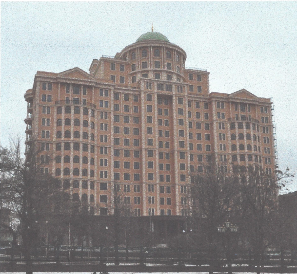
Бизнес-центр «Столичный» в Донецке — шедевр современной архитектуры от Александра Януковича

Его Всеукраинский Банк Развития растет сумасшедшими темпами : на начало прошлого года активы банка выросли на 750%; объемы кредитов для юрлиц увеличились в 6,5 раза. Остатки денежных средств юрлиц на счетах в банке выросли в 129 раз.