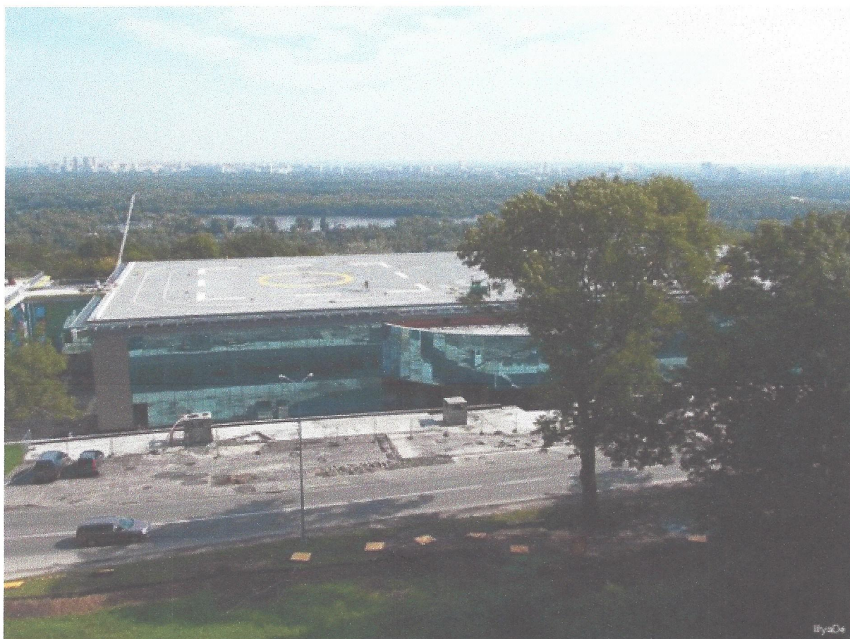
Сверху — вертолетная площадка Януковича. Снизу — бизнес-центр

Примечательно, что две старые и две новые офшорные фирмы засветились и в другой структуре, близкой к Януковичу. Это — британская Fineroad Business LLP. Как установила «Украинская правда» , именно этой компании принадлежит один из VIP-объектов в самом центре Киева — так называемая «вертолетная площадка Януковича». Если так можно назвать многоэтажный бизнес-центр с местом для посадки вертолетов на крыше.